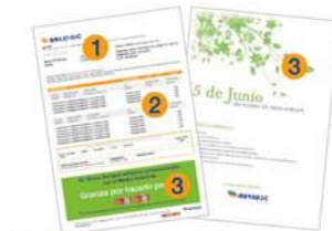
Ejemplo de documento transaccional: